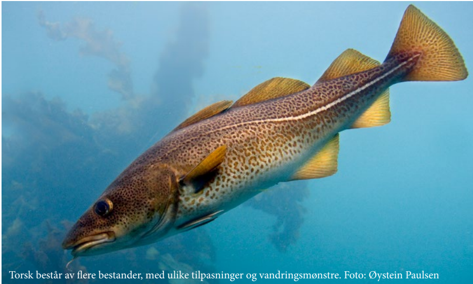
Torsk består av flere bestander, med ulike tilpasninger og vandringsmønstre.

Ytre Oslofjord har store naturverdier som det er viktig å sikre for kommende generasjoner, herunder flere fiskebestander som er sterkt redusert de siste årene. Dette er bakgrunnen for prosjektet «Krafttak for kysttorsken» som ble startet opp i 2017, der Færder og Ytre Hvaler nasjonalparker, Vestfold og Østfold fylkeskommune, Havforskningsinstituttet, Fiskeridirektoratet og Miljødirektoratet samarbeider med yrkes- og fritidsfiskere og lokalsamfunn i regionen. Målet er økt kunnskap om økosystemet og fiskebestandene, og utprøving av tiltak for om mulig å øke torskebestanden i fjorden.