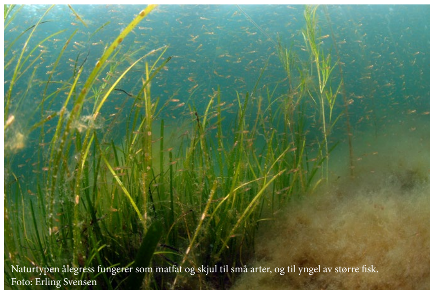
Naturtypen ålegress fungerer som matfat og skjul til små arter, og til yngel av større fisk.

«Kysttorsk» er torsk som holder til i kystnære områder hele livet, og som har sine gyteplasser i fjorder eller mellom øyer, holmer og skjær. Studier av kysttorskens adferd og bevegelser viser at den er trofast til et begrenset område, og man sier gjerne at den er «stedbunden». Genetiske undersøkelser har vist at kysttorsken utgjør lokale bestander som er forskjellige fra torskebestander som har sine gyteområder lenger ute i Skagerrak og Nordsjøen og som vandrer over større områder. For å gjenreise kysttorsken må man sikre at lokal torsk vokser opp, trives og gyter i fjordene. Naturtypene som kysttorsken er avhengig av må være i tilstrekkelig «god tilstand».