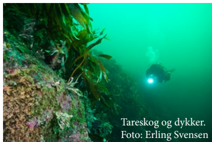
Tareskog og dykker.