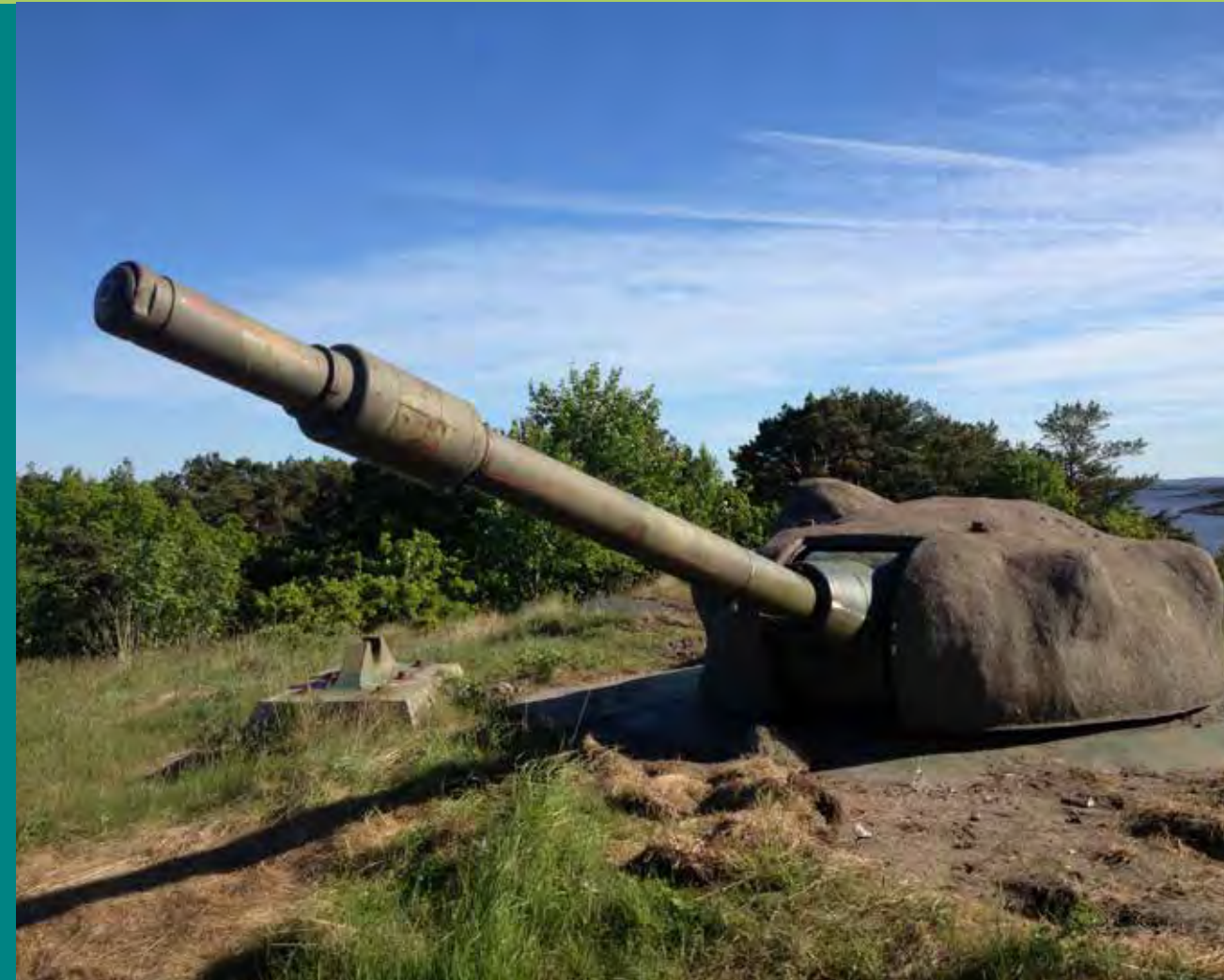
Inngang til kanon standplass Entrance to gun site