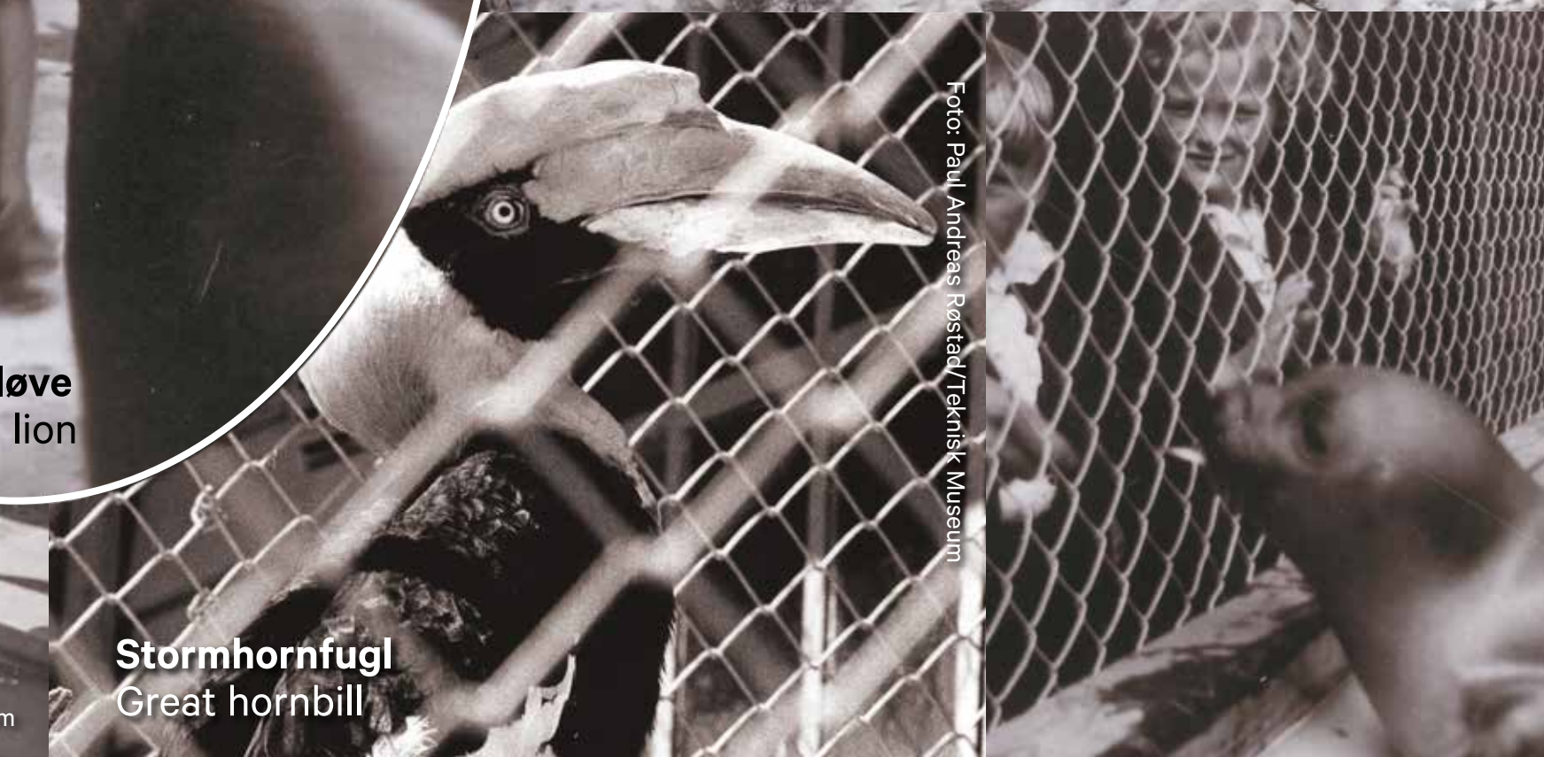
Stormhornfugl Great hornbill