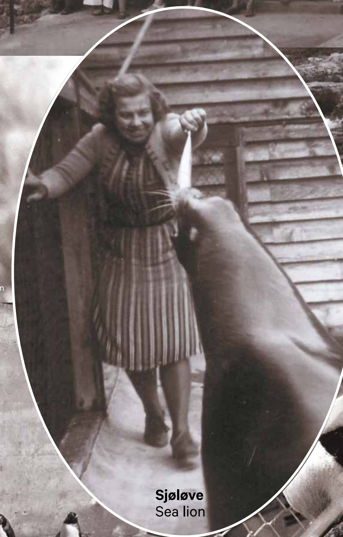
Sjøløve Sea lion