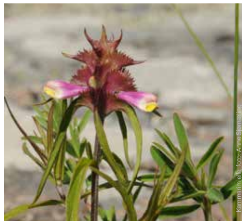
Kammarhjelle, foto: Anne Stormsølling

Mellom-Bolæren er en øy med særpreget og variert natur, og et til dels gjengrodd kulturlandskap hvor det gjøres en rekke skjøtselstiltak. Øya har kulturminner fra bronsealder til nyere tid, og har merket kyststi og flere tema- og informasjonstavler. Foreningen Mellom-Bolærens Venner utfører oppgaver knyttet til bevaring av kulturverdiene på øya, deriblant rehabilitering og vedlikehold av bygninger, skjøtsel av kulturlandskapet og guiding. Mellom Bolæren har en flytebrygge der båtbrukere kan legge til, og det finnes enkle toaletter og søppelbod på øya. Kystledhytte (ubetjent hytte) kan leies via nettsidene til Oslofjordens Friluftsråd. Det er merket kyststi over øya, og nasjonalparkforvaltningen har satt opp flere tema-informasjonstavler.