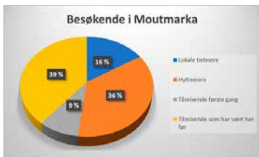
Fig. 1: Hvilke områder som benyttes i Moutmarka (n = 216).

I 2016 gjennomførte studenter ved Norges miljø- og biovitenskapelige universitet en brukerundersøkelse i Moutmarka på oppdrag fra Oslofjordens Friluftsråd som grunneier, og i samarbeid med nasjonalparkforvalter. I undersøkelsen ble det gjort 216 intervjuer av til sammen 426 personer, med 1448 passeringer. Rapporten gir en god indikasjon på de ulike brukergruppene: 16 % var lokale beboere, 36 % hytteeiere, 9 % tilreisende førstegang og 39 % tilreisende som hadde vært her før (figur 1). Det er grunn til å tro at «tilreisende første gang» vil øke etter hvert som området blir mer markedsført via nasjonalparken.