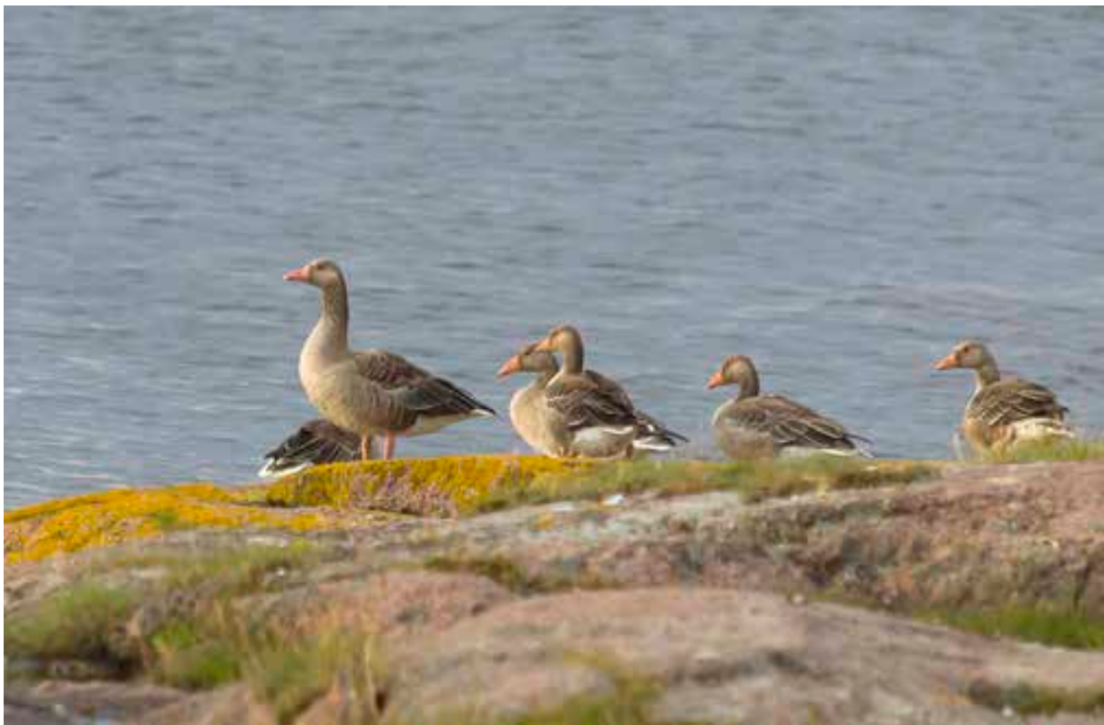
Grågåsa har blitt mer og mer vanlig.

Friluftsliv er en meget positiv aktivitet i nasjonalparken, men kan føre til slitasje på utsatte steder. Enkelte naturtyper er så lite motstandsdyktige mot tråkk, telting etc. at selv hensynsfull ferdsel kan utgjøre en trussel. På slike steder er det en utfordring å kanalisere friluftaktiviteten slik at verneverdiene ivaretas, samtidig som brukernes opplevelser ikke blir vesentlig redusert.