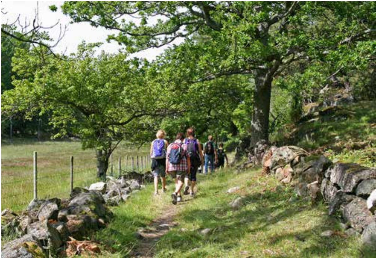
Gårdsvei på Søndre Årøy.