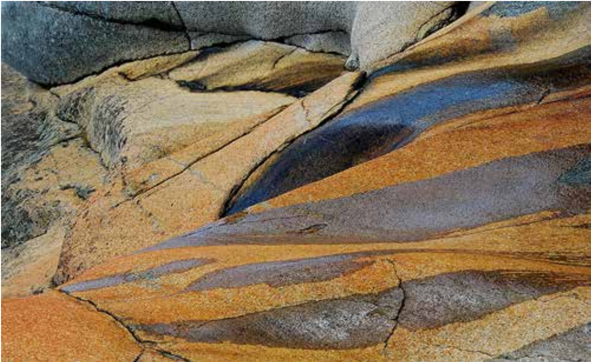
Geologien er spektakulær i parken.

Nye, tekniske inngrep som representerer en varig påvirkning av naturmiljø eller kulturminner er den største trusselen mot verneverdiene. Vernets hovedsiktemål er derfor å sikre området mot slike inngrep. Dette innebærer at eksisterende bruk av området stort sett kan foregå som før. En annen betydelig utfordring er gjengroing av kulturlandskapet som følge av store endringer i landbruket.