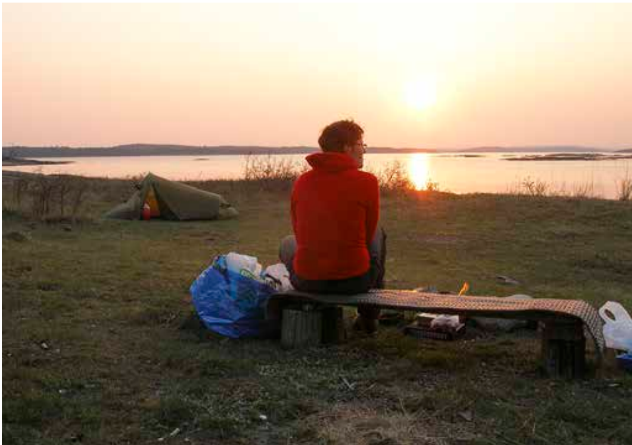
Mange overnatter i telt i skjærgården om sommeren.