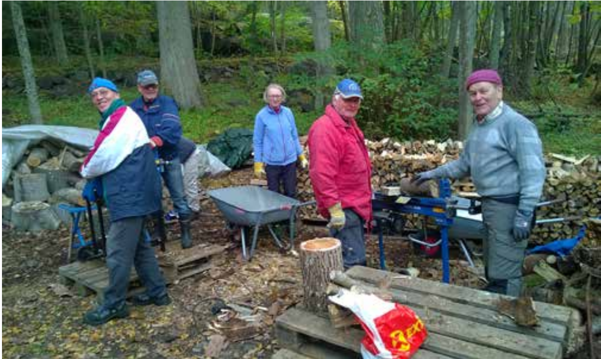
Nasjonalparken nyter godt av mange frivillige.