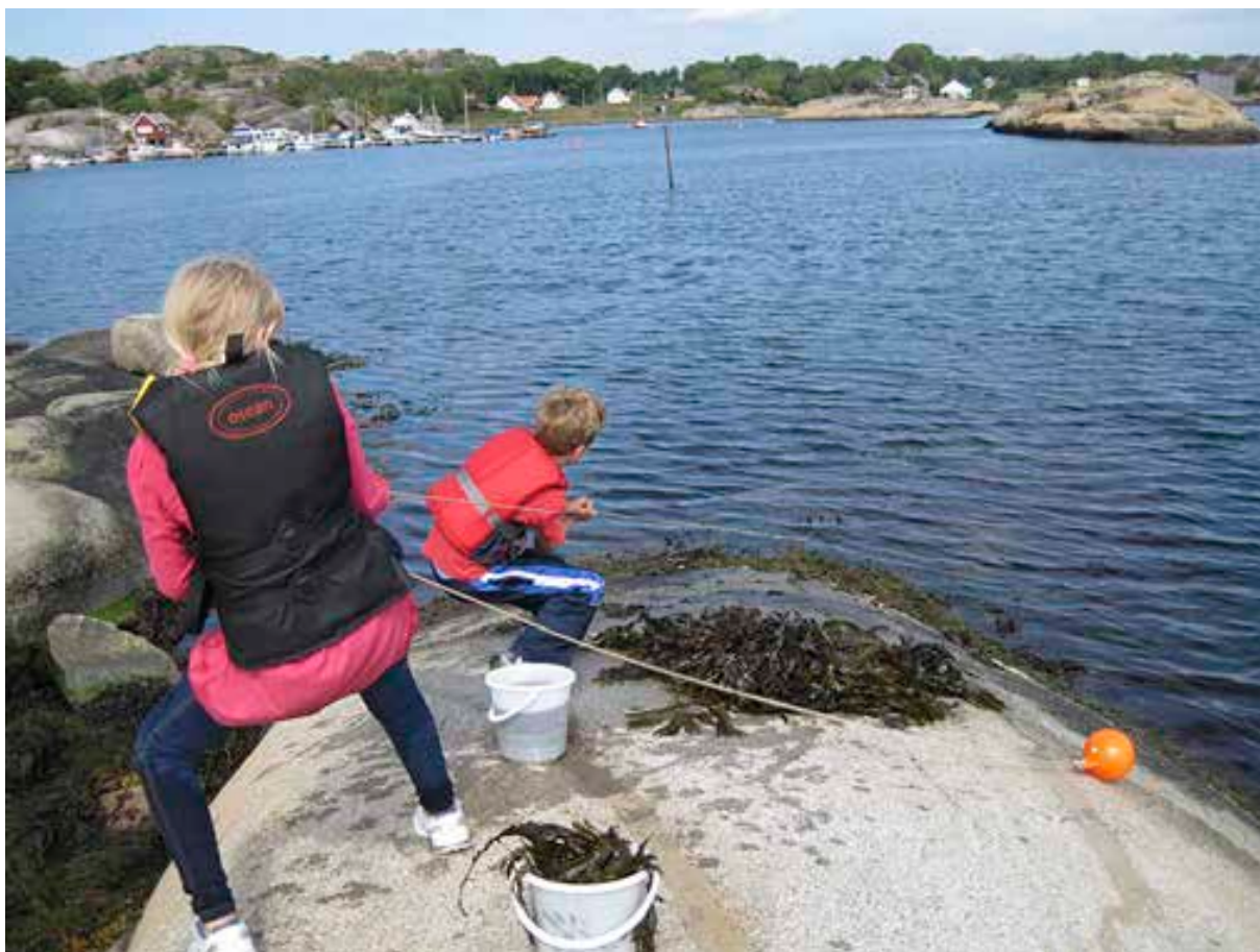
Oslofjordens Friluftsråd har undervisningsopplegg i nasjonalparken.