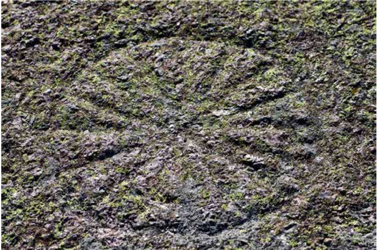
Kompassrosa på Østre Bolæren.