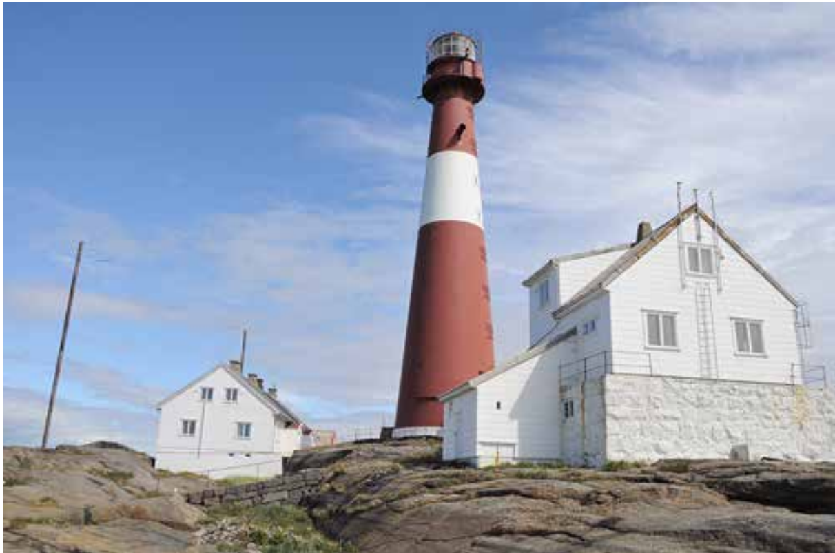
Færder fyr.