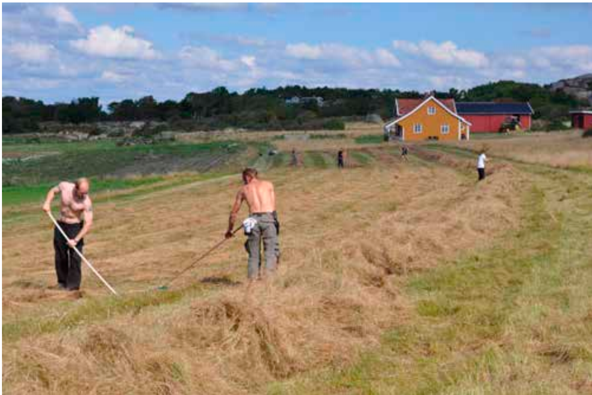
Slåttearbeid på Sandø.