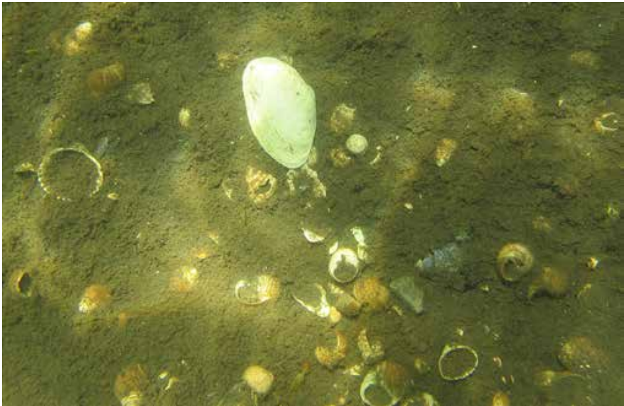
Bløtbunn i strandsonen.

Økt avrenning fra land på grunn av økte nedbørsmengder og eventuelt dårlige rutiner i forhold til bearbeiding av jordbruksområder, vil føre til økt transport av partikler og næringssalter fra land til sjø. Dette vil igjen føre til både reduserte lysforhold og økt sedimentering i kystområder. Økt produksjon av planteplankton og eventuelle endringer i næringsnettene i åpne kystfarvann vil også kunne føre til økt sedimentering av partikler til dype havområder. Økt sedimentering, eller økt organisk belastning i sjøområder, fører til økt nedbryting ved sjøbunnen, og kan føre til oksygenvinn i bunn og bunnvann og dårlige økologiske forhold.