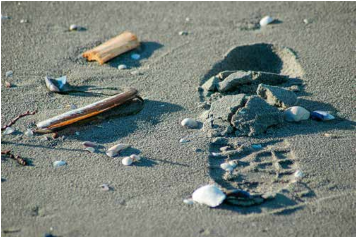
Skjellsand på Sandø.

Ålegraset har i tillegg en spesiell utfordring der det anlegges brygger eller mange båter bøyelegges på samme sted. Ålegras trenger lys, og flytebrygger etc. på overflaten kan derfor skygge ut plantene selv om de ikke representerer store inngrep direkte i sjøbunnen.