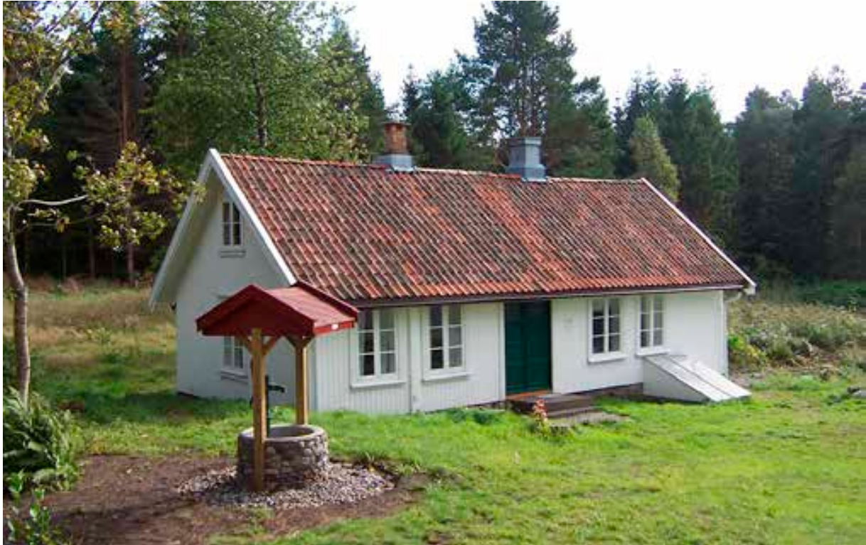
Nordre Jensesund.