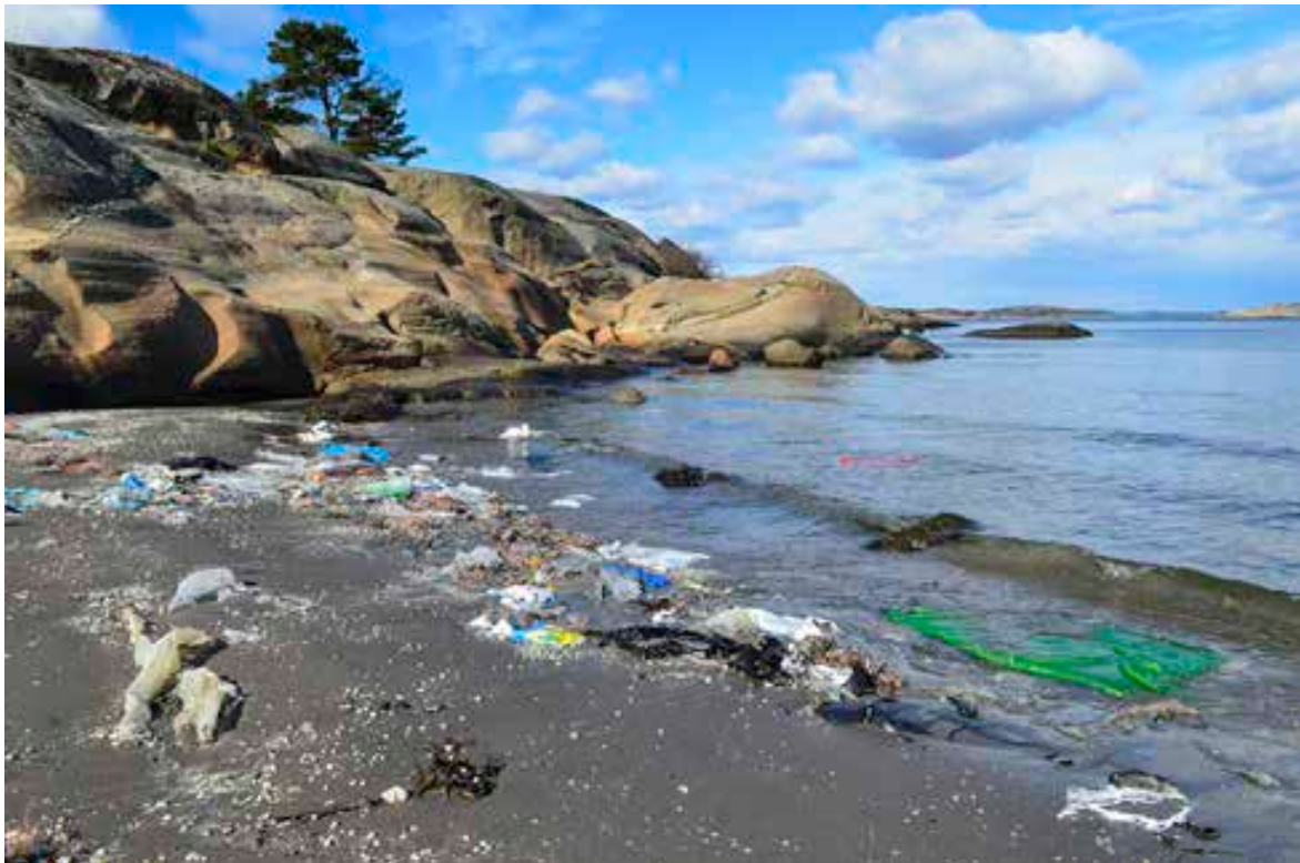
Nordbukta på Sandø tidlig på våren.

Store deler av nasjonalparken omfatter sjøområder. Det er viktig at alle aktørene er orientert om sjøfuglsituasjonen dersom oljeforurensning truer på havet, og tar forholdsregler for å beskytte arter og miljøet. Hekkeområdene til sjøfugl (de tidligere sjøfuglreservatene) samt myte- og overvintringsområder vil være blant de høyest prioriterte områdene i nasjonalparken både når det gjelder skjerming og opprydding. Fylkesmannen er pålagt å sørge for implementering av "Modell for prioritering av miljøressurser ved akutte oljeutslipp langs kysten". Områdene som er prioritert i henhold til denne modellen danner et svært viktig grunnlag for prioritering av innsats under aksjoner mot akutt forurensning.