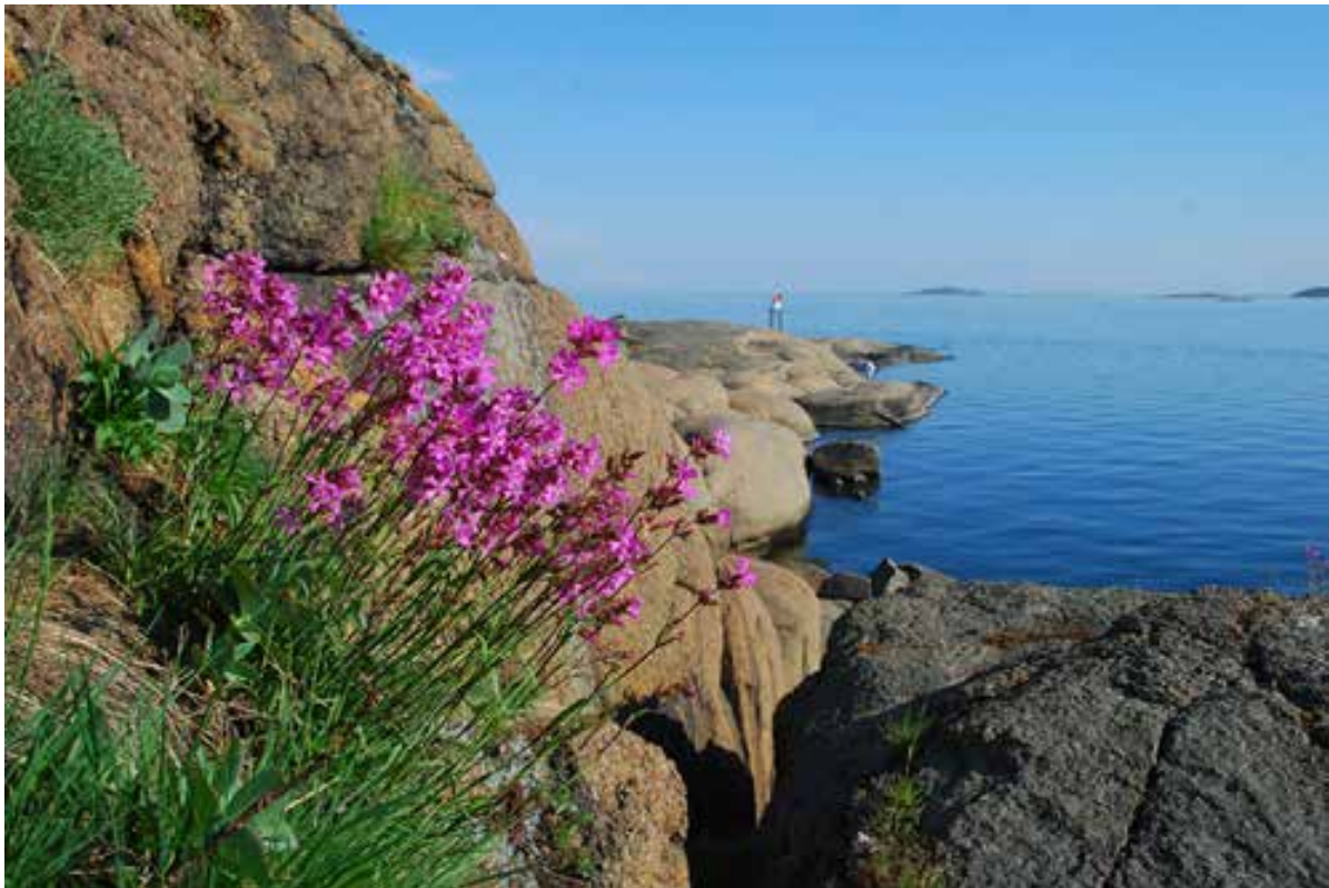
Tjæreblom på Lindholmen.