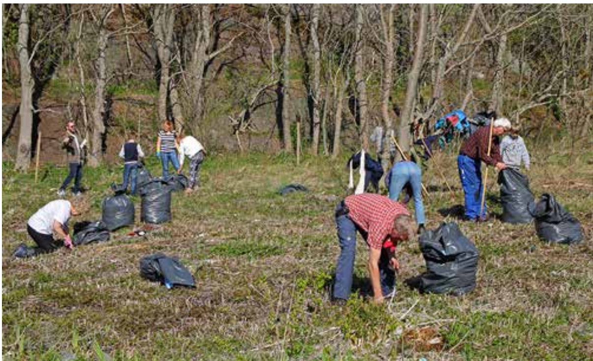
Årlig strandryddeaksjon i regi av Skjærgårdstjenesten, Oslofjordens Friluftsråd og nasjonalparken.