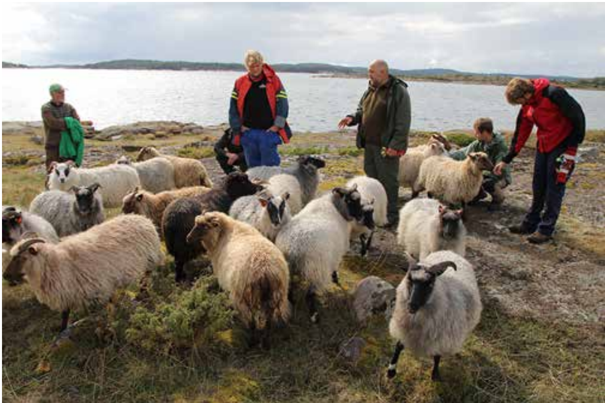
Gammelnorsk spælsau brukes i skjøtselsarbeidet.

Rådgivende utvalg. I henhold til § 8 i verneforskriften skal det etableres et rådgivende utvalg for forvaltningen av området. Utvalget oppnevnes av nasjonalparkstyret. Sammensetningen fastsettes når styret er oppnevnt. Det er naturlig at for eksempel representanter for grunneiere, organisasjoner, næringsdrivende og berørte offentlige myndigheter inngår.