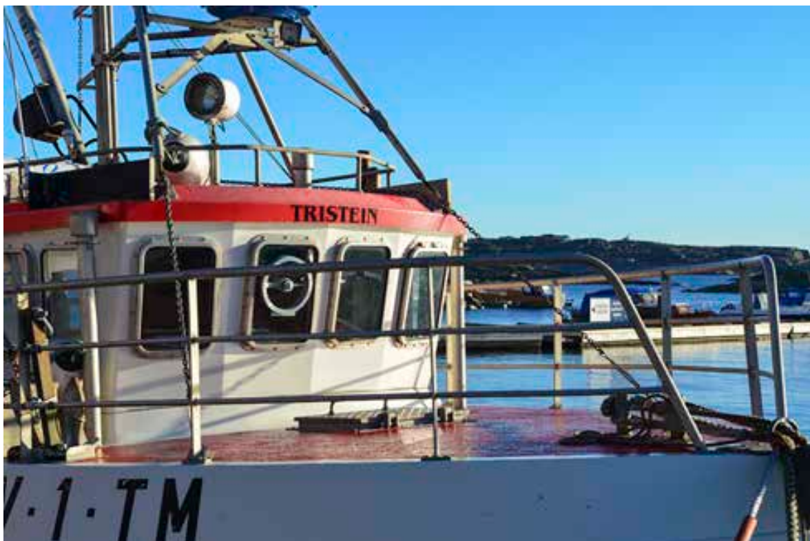
Skøyta Tristein.