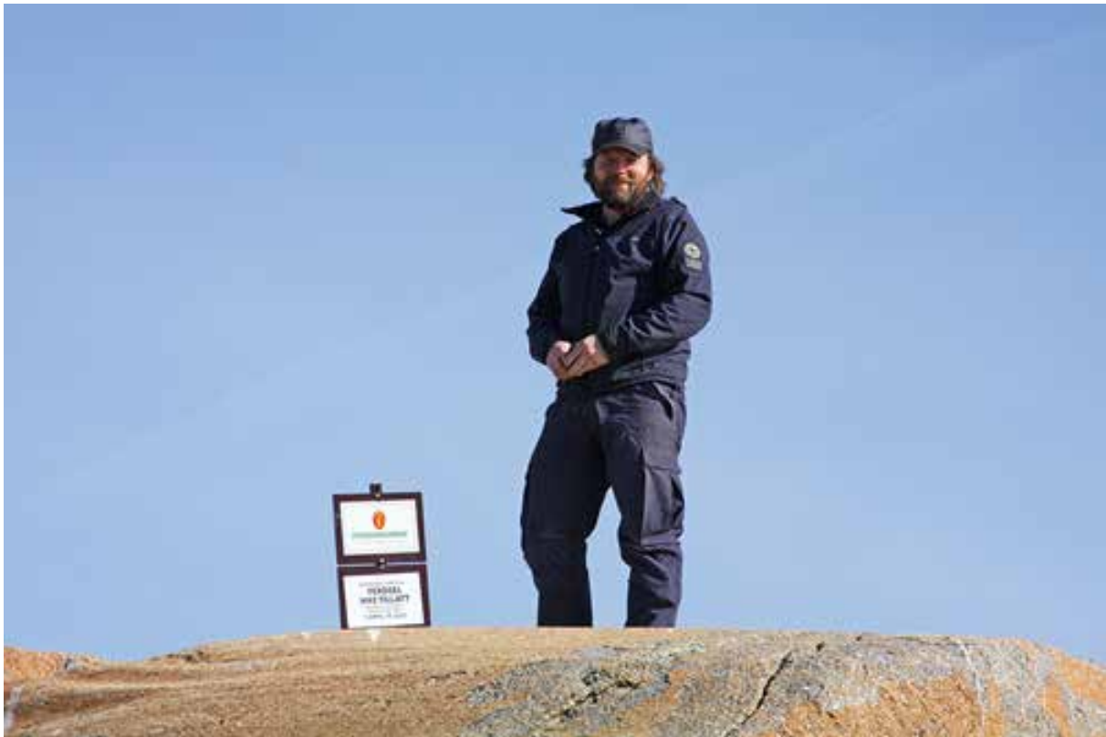
Statens naturoppsyn er oppsynsmyndighet.