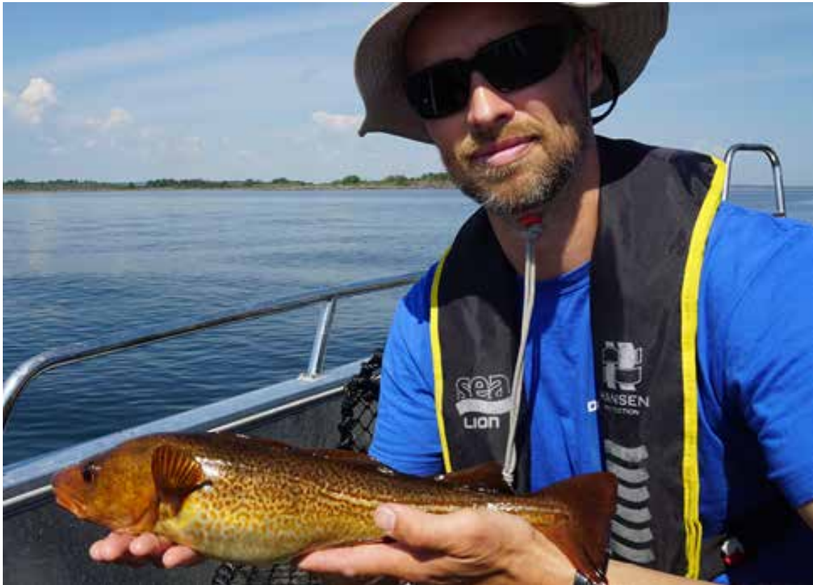
Prøvefiske etter kysttorsk.