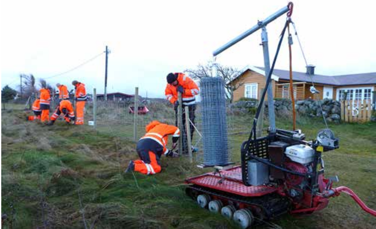
Gjerding i Moutmarka for beitedyr.

Ved vurdering av om den ønskede skjøtselen samlet sett er akseptabel, skal det legges stor vekt på de botaniske verneverdiene.