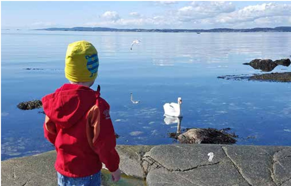
Moutmarka en vårdag.