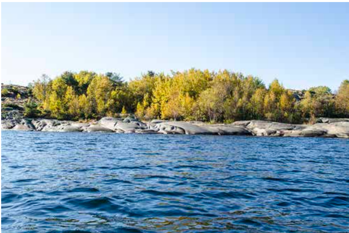
Høst på Froungen øst.