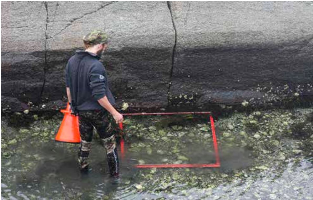
Stillehavsøsters er i ferd med å bli en stor utfordring.

Stillehavsøsters ( Crassostrea gigas ). Invasjonen av stillehavsøsters i perioden 2005-2008 skjedde sannsynligvis via larver, som fulgte med havstrømmen fra store forvillede østerspopulasjoner i Danmark. Det har også vært drevet oppdrett av stillehavsøsters i Norge siden midten på 1970-tallet.