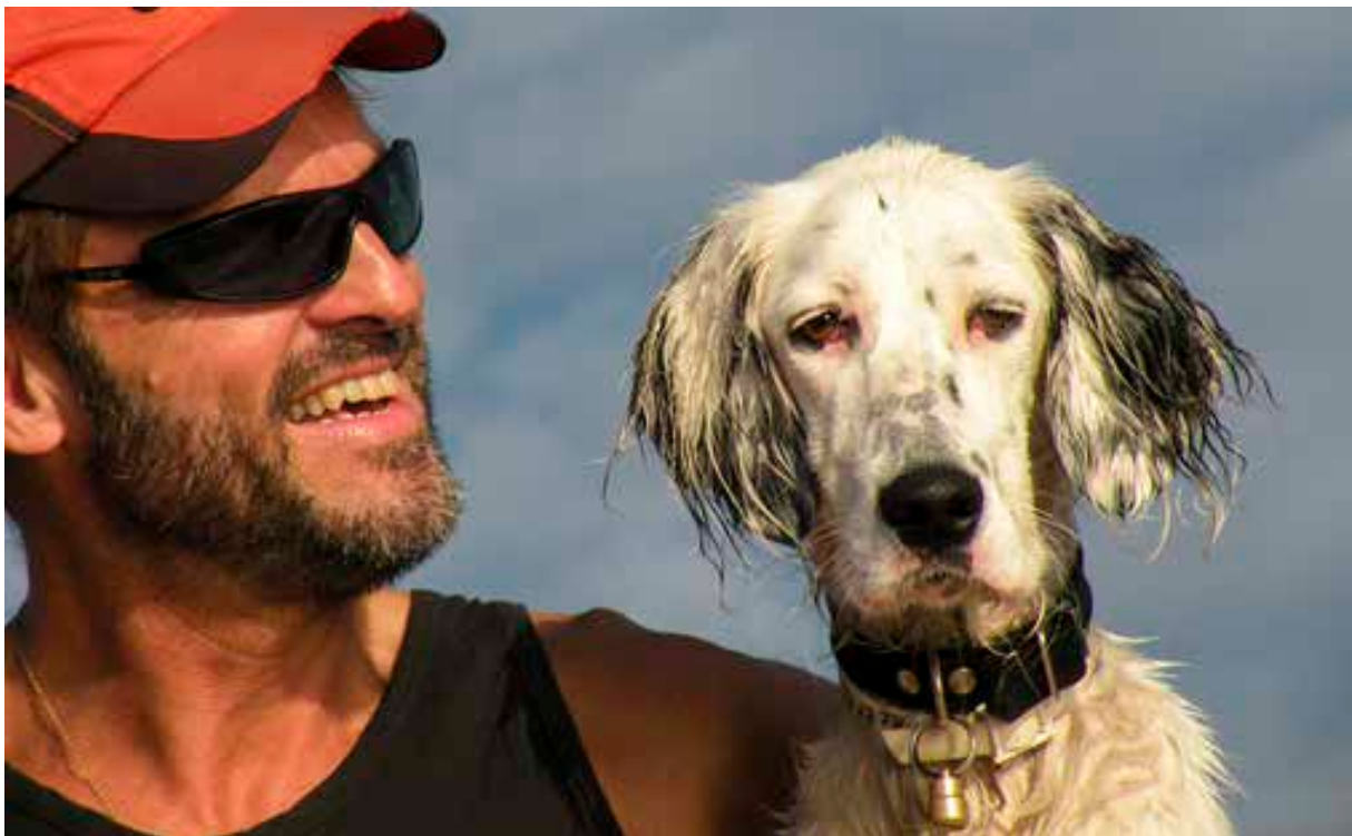
I sone B skal hunder holdes i bånd hele året.

Bestemmelsene i Forskrift om brannforebygging gjelder også i nasjonalparken. Det innebærer at all bålbrekking i eller i nærheten av skogsmark er forbudt uten brannsjefens tillatelse i tiden 15. april – 15. september.