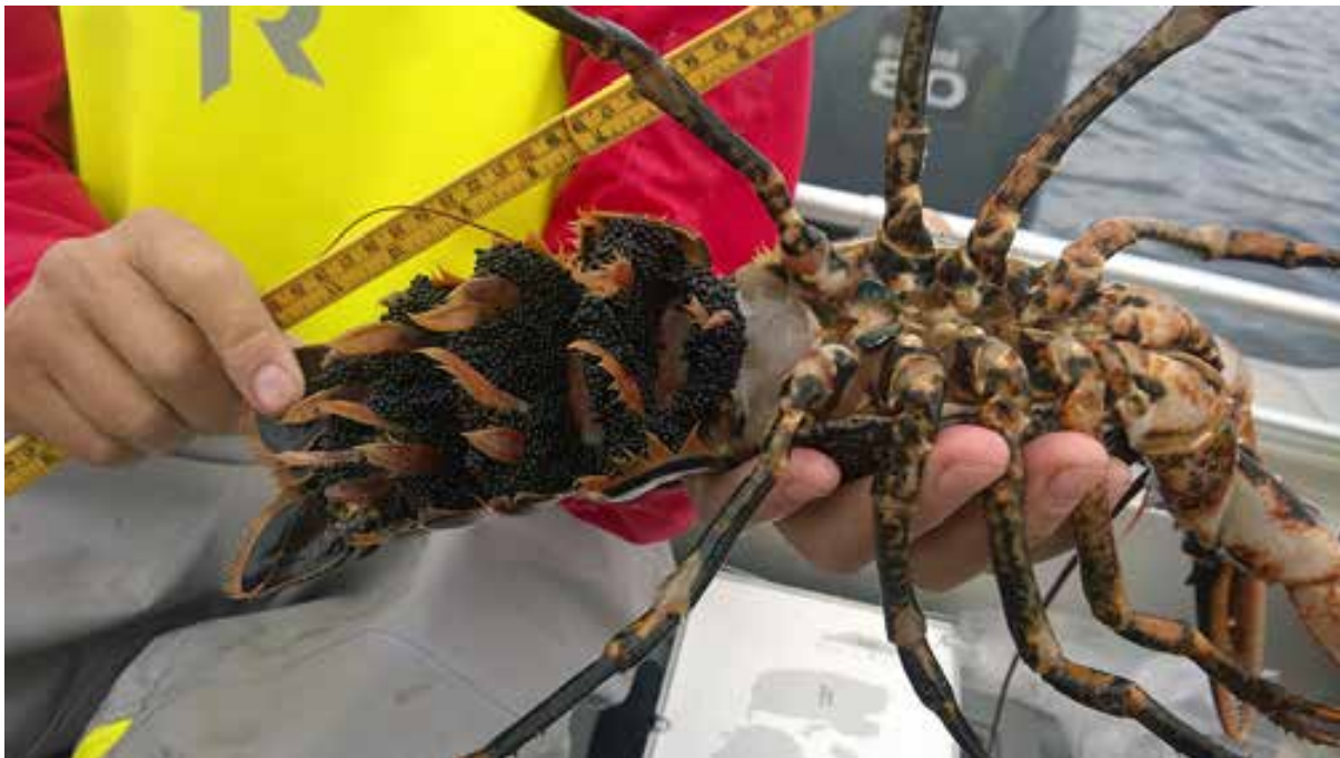
Overvåking av hummerfredningsreservatene.