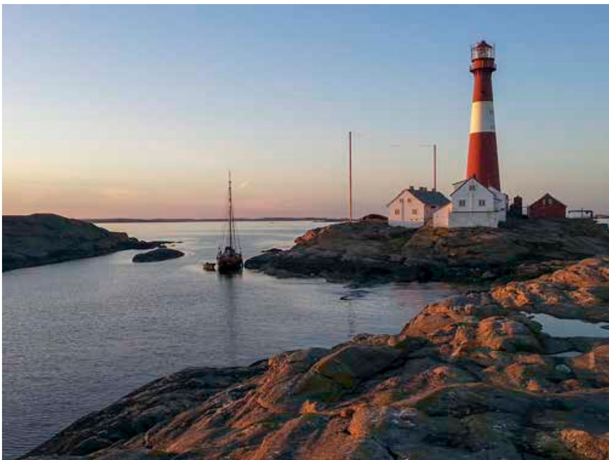
Færder fyr er et av Kystverkets anlegg.