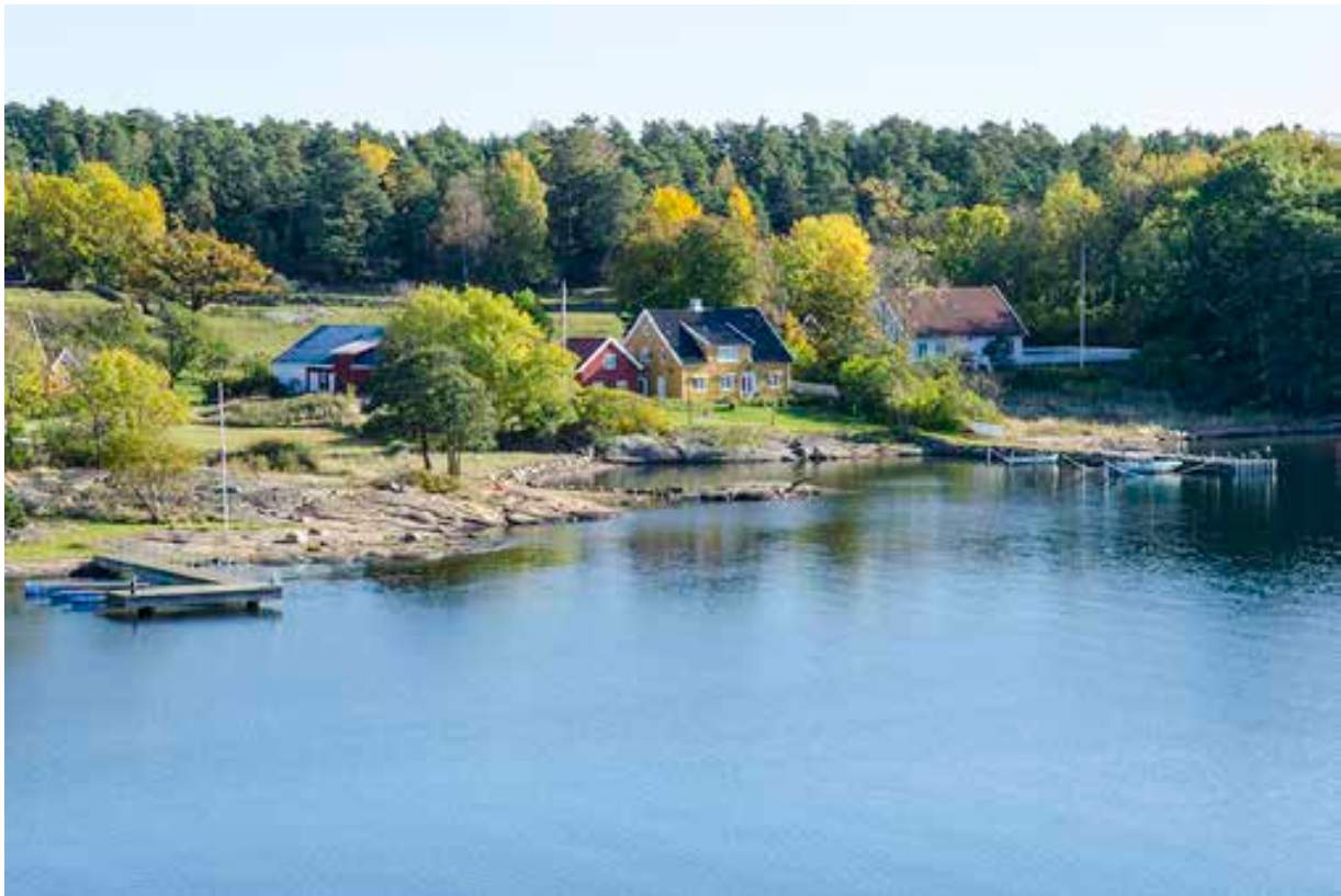
Søndre Årøy.