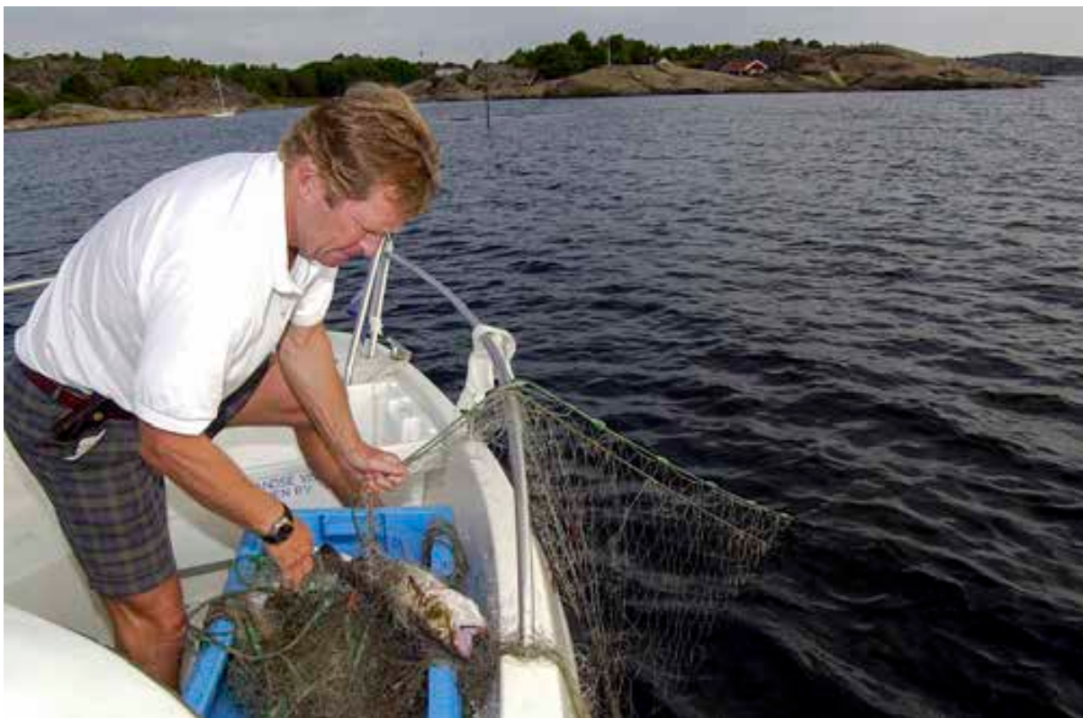
Fritidsfisket har vært omfattende.