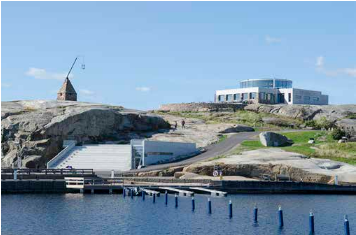
Besøkscenter nasjonalpark Færder.