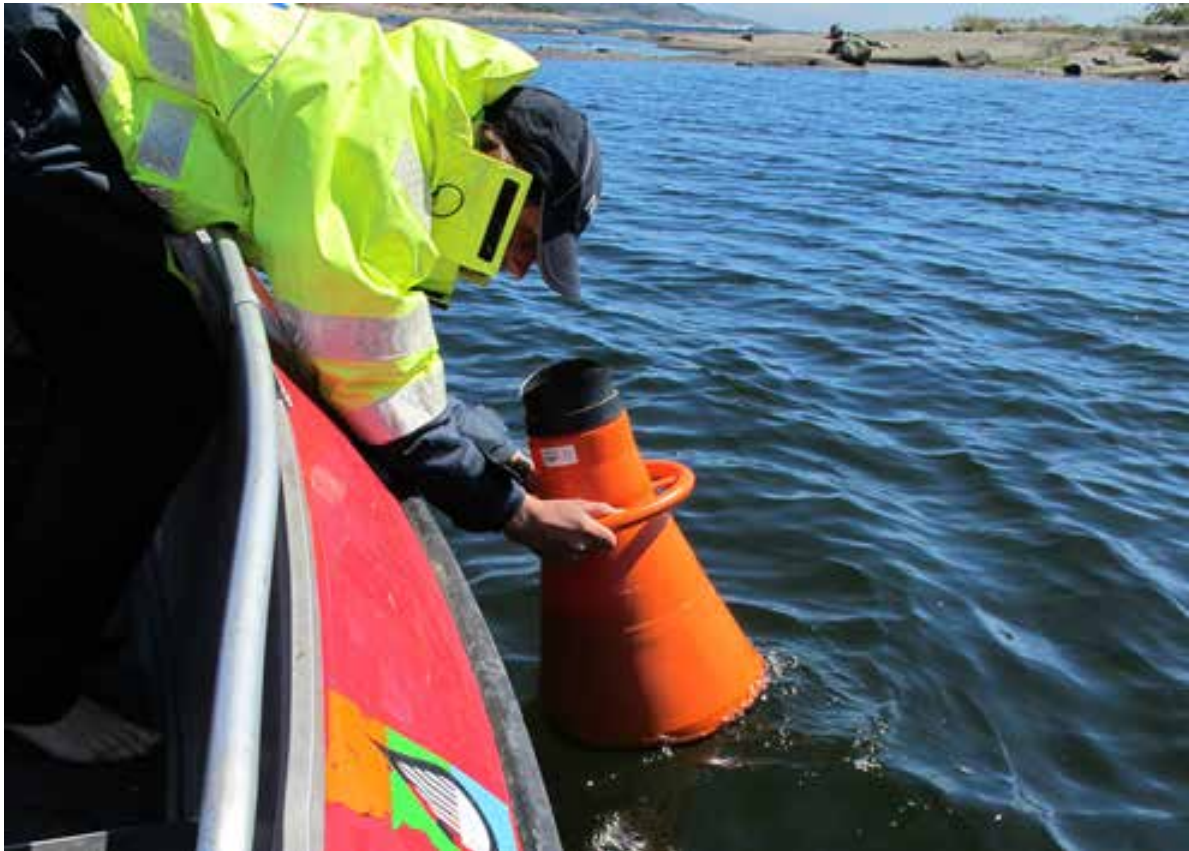
NIVA utredet i 2012 naturkvaliteter i parken.

spre seg også til andre øyer, spesielt de større øyene nærmest land. Sneglen utkonkurrerer den vanlige norske skogsneglen, og kan gjøre stor skade på vegetasjon og matvekster.